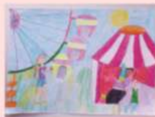
Карабашева Калерия 3 «В»