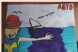
Гранкина Лиза 4 «Б»