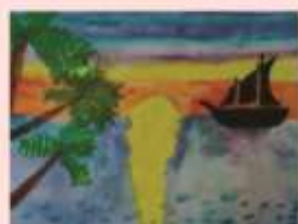
Бизюк Матвей 4 «Г»