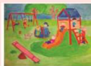
Белоножка Дарья 4 «В»