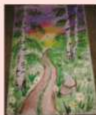
Пальченко Дарья 4 «Б» 2 «В»