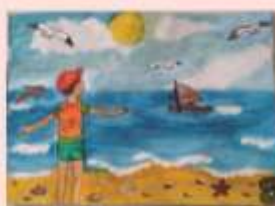
Золоторев Сергей 4 «В»