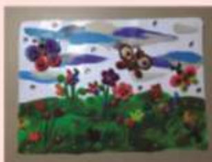
Воскобой Маргарита 2 «В»