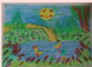
Олешкевич Вероника 3 «Б»