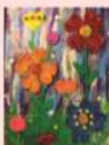
Бутко Артём 2 «В»