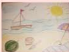
Ахметов Тамир 4 «В»