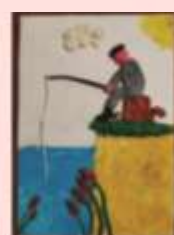
Слушаевский Трофим 2 «В»