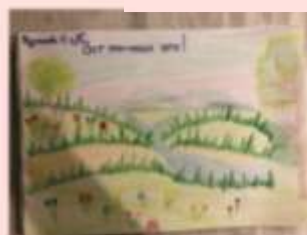
Нурланова Сафия 3 «В»