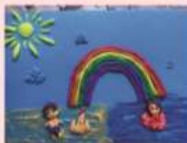
Гобеник Лена 2 «В»