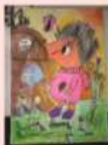
Ахмутинова Дамина 2 «Б»