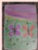
Ровнов Роман 4 «Г»