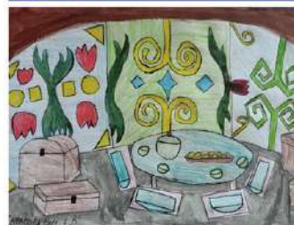
Тарасова Варвара, 4 «В»