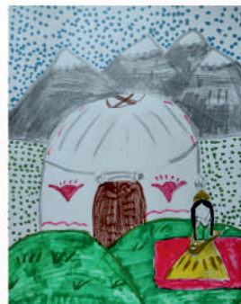
Кузлякина Лиза, 4 «В»