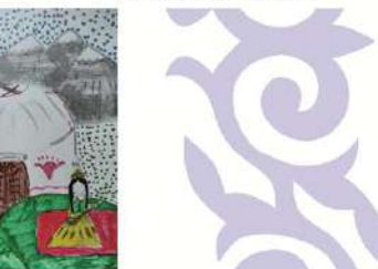
Кузлякина Лиза, 4 «В»