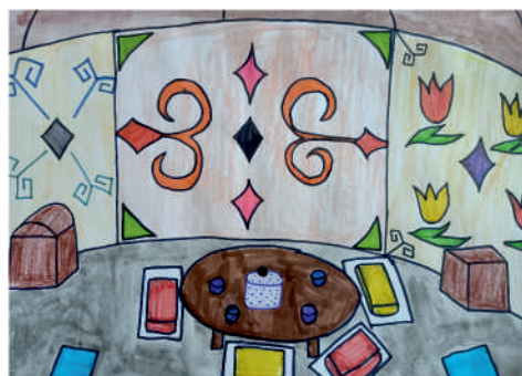
Галлямова Наиля, 4 «В»