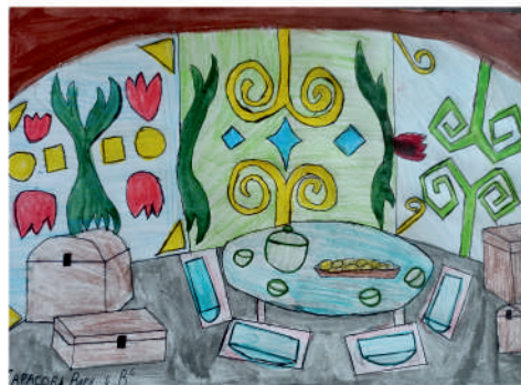
Тарасова Варвара, 4 «В»