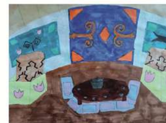
Зарипова Ясмин, 4 «Б»