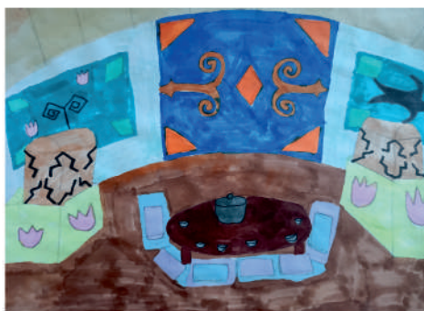
Зарипова Ясмин, 4 «Б»