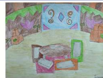
Гайсина Алина, 4 «Б»