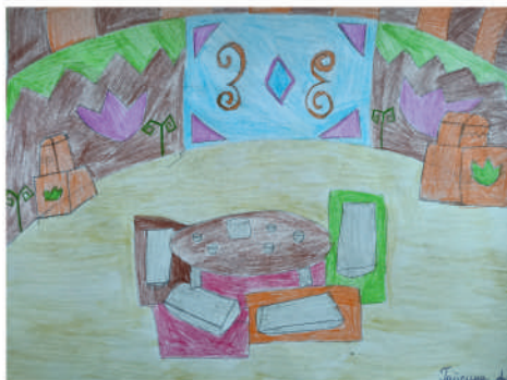
Гайсина Алина, 4 «Б»